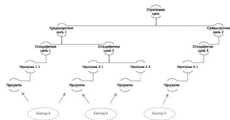
Шема 4: Хијерархија циљева и програма средњорочног плана институције

Остваривање средњорочних циљева заснива се на провођењу приоритетних програма. Програми се могу састојати од једног пројекта или више пројеката. Пројекти се састоје од активности. Сваки програм средњорочног плана може имплементирати једна или више организационих јединица институције. Хијерархија циљева и програма приказана је у Шеми 4.