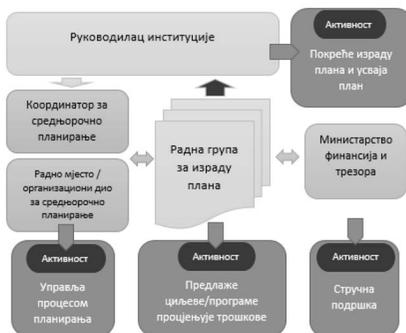
Шема 5: Управљање процесом израде Средњорочног плана

У Шеми 5 представљен је примјер организације процеса средњорочног планирања у институцији.