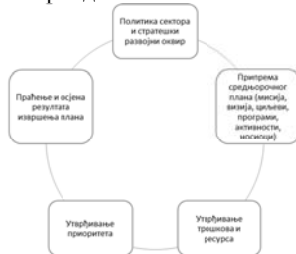
Шема 2: Циклични процес средњорочног планирања

Планирање је цикличан процес и ови кораци се понављају сваке године (Шема 2). Програми и пројекти могу се током планског циклуса дјелимично мијењати, јер су подложни утицају различитих формалних процеса који могу мијењати динамiku реализације (нпр., промјене у процесу ЕУ-интеграције, СЕФТА режиму, регионалним политикама итд.). Те промјене могу утицати и на критеријуме за одређивање приоритета. У сваком случају, резултати евалуације извршења плана утичу на измјене плана за наредни период.